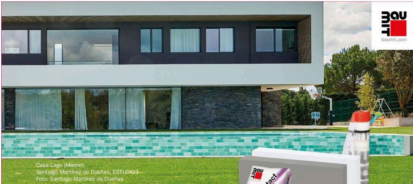
Casa Lago (Madrid) Santiago Martínez de Dueñas, ESTUDI03