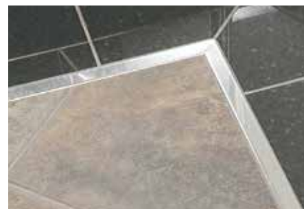
Schlüter®-DESIGNLINE-E en la zona del suelo