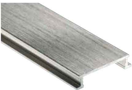
Schlüter®-DESIGNLINE-AGBE anodizado cepillado (-ATGB)

DESIGNLINE-E está fabricado a partir de tiras de acero inoxidable V2A (material 1.4301 = AISI 304). El acero inoxidable está especialmente indicado para aplicaciones con altas agresiones mecánicas y químicas, p. ej., en aquellas zonas donde se emplean medios y productos de limpieza ácidos o alcalinos. El acero inoxidable no resiste a todas las agresiones químicas, por ejemplo, al ácido clorhídrico y fluorhídrico o a determinadas concentraciones salinas y de cloro. Este hecho en determinados casos también es aplicable a las piscinas de agua salada. Agresiones especiales se deben comprobar antes de la instalación de los perfiles.