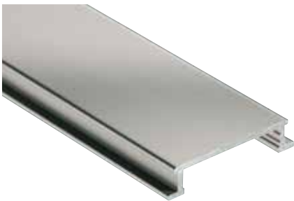
Schlüter®-DESIGNLINE-AME anodizado mate (-AT)