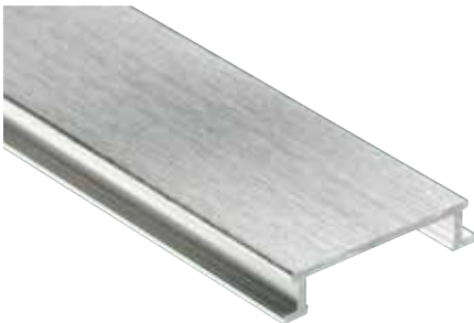
Schlüter®-DESIGNLINE-AGBE anodizado cepillado (-ACGB)